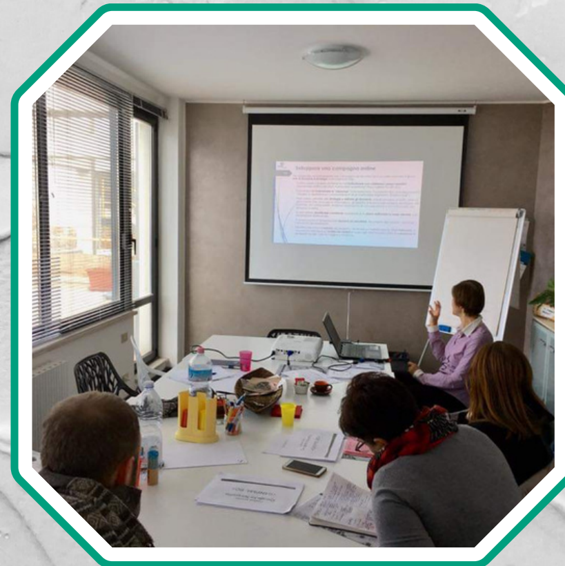
Formazione del personale interno all'organizzazione