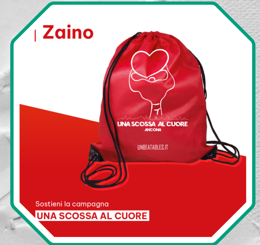
Progettazione e gestione di campagne di crowdfunding