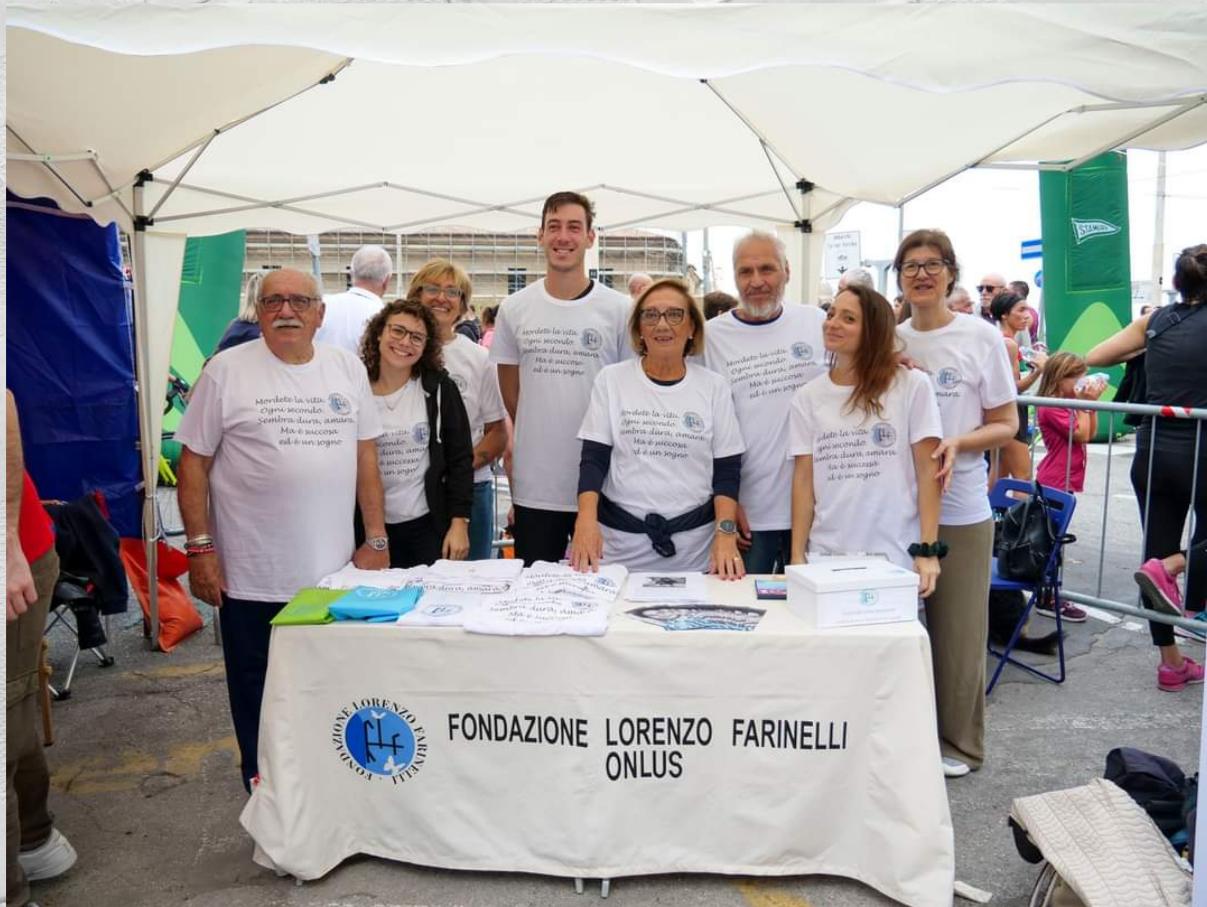
Banchetto Fondazione Lorenzo Farinelli Onlus