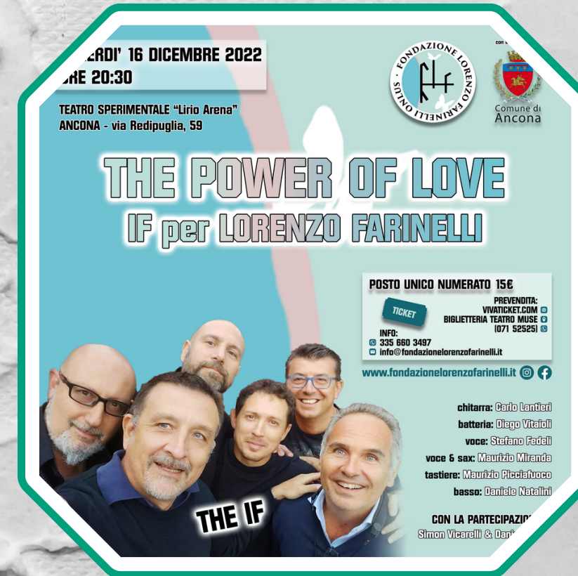
Progettazione ed organizzazione di Eventi di Raccolta Fondi