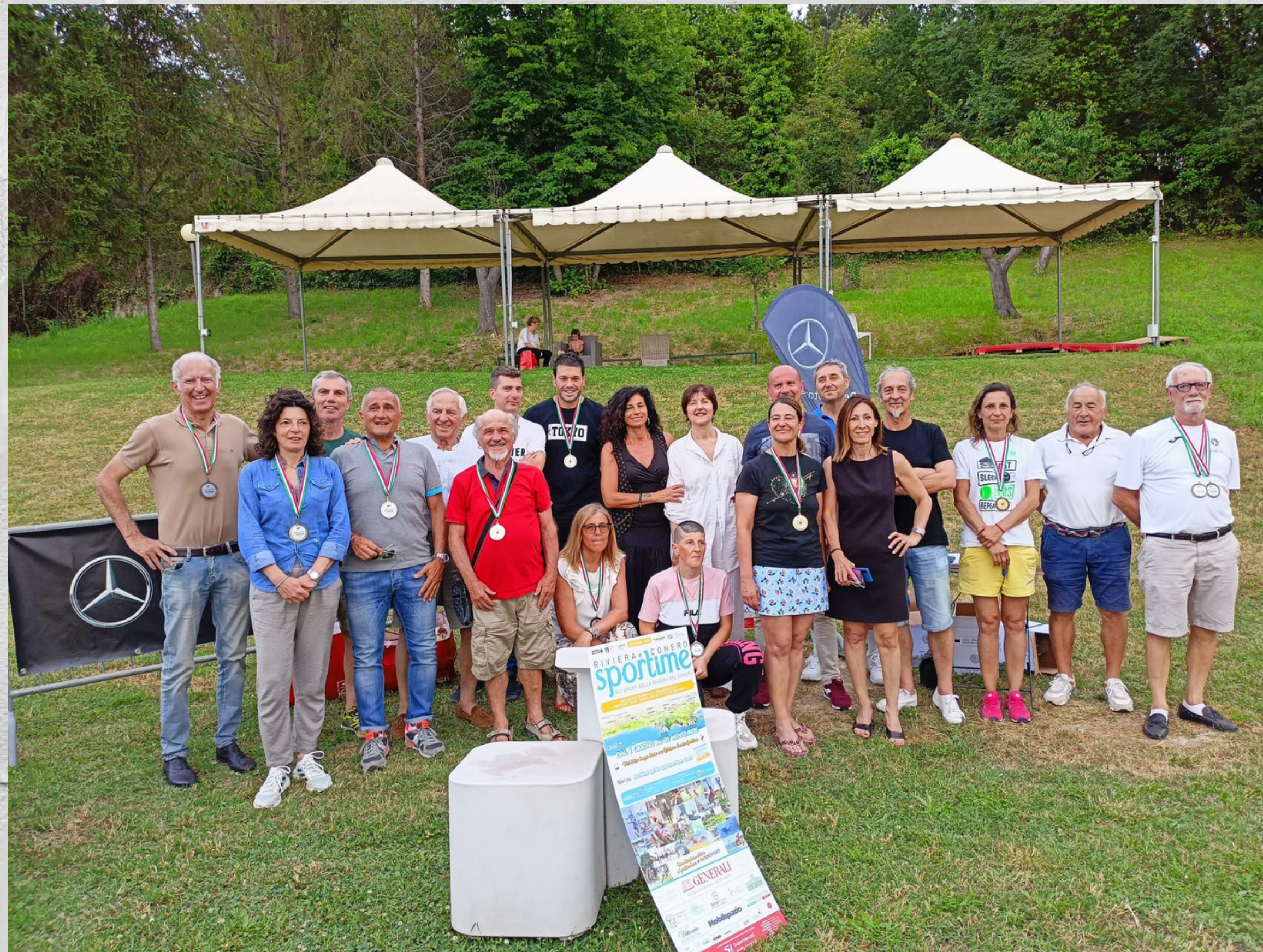
Circolo Tennis Pietralacroce Premiazioni Finale di Torneo