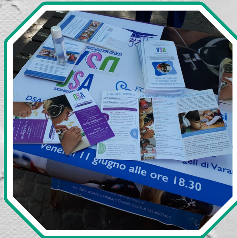
Elaborazione di un Piano Strategico di Fundraising