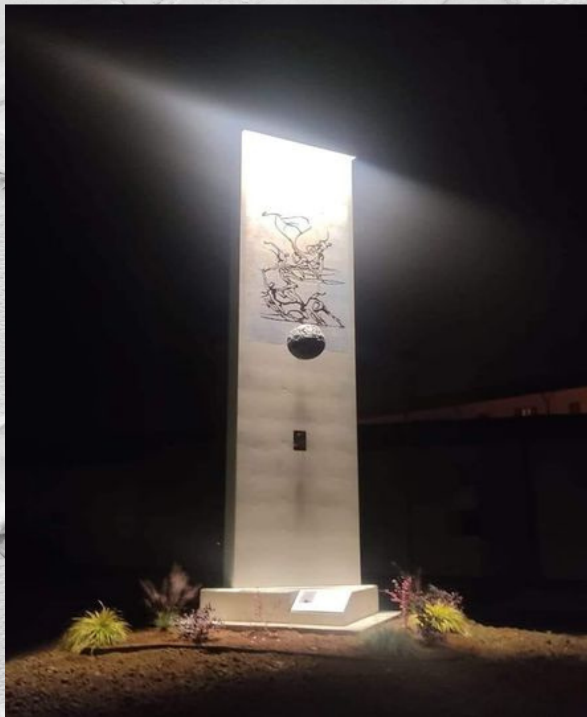
"Dal buio alla luce" opera Franco Scepri iGuzzini sponsor tecnico